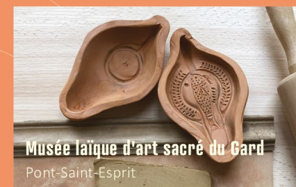
Musée laïque d'art sacré du Gard Pont-Saint-Esprit