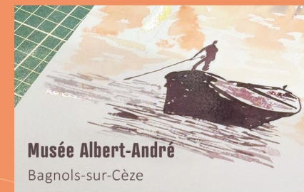
Musée Albert-André Bagnols-sur-Cèze