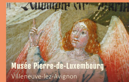
Musée Pierre-de-Luxembourg Villeneuve-lez-Avignon