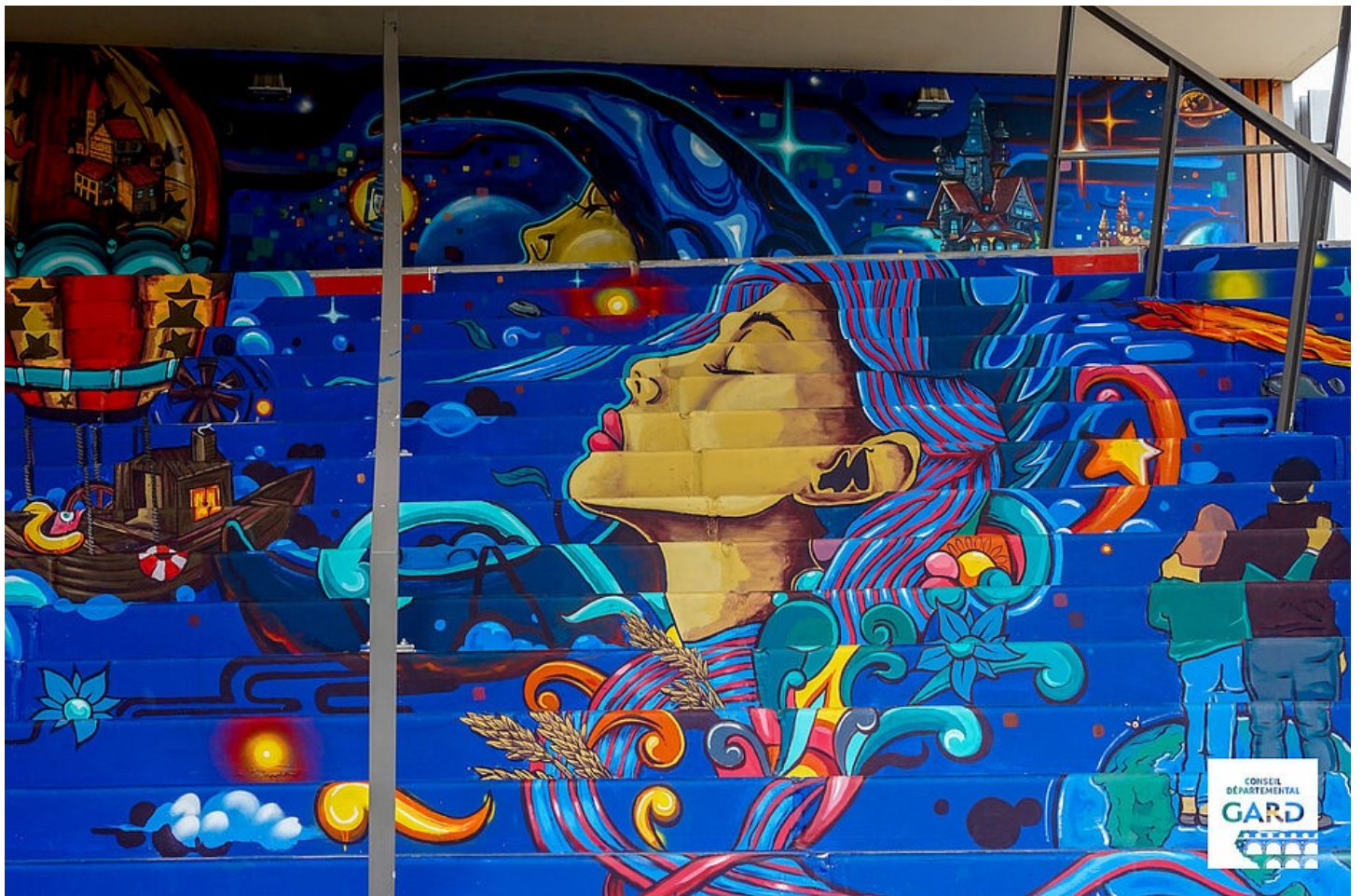
Fresque réalisée dans le cadre du dispositif artistes au Collège 2024 : travail créatif de l'artiste peintre Suno

En fin de résidence, les artistes présentent leur création menée au collège et les élèves présentent, quant à eux, le résultat des ateliers menés avec les artistes. Ces résidences permettent de nouer un dialogue privilégié entre les créateurs et les élèves sur le sens de leur projet et de les initier aux pratiques artistiques, ainsi qu'à l'exigence qu'elles requièrent et au plaisir qu'elles occasionnent.