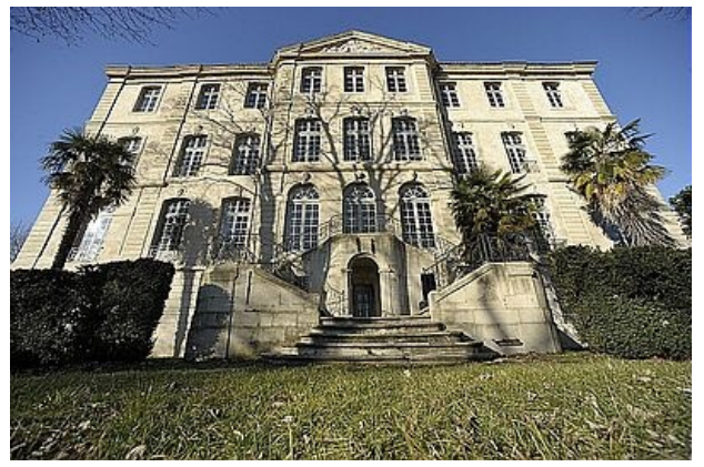
Musée d'Art contemporain du Château d'Assas