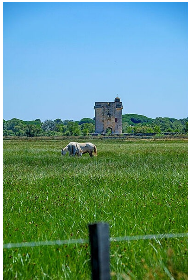
La Tour Carbonnière à Saint-Laurent d'Aigouze s'élève au milieu d'un espace naturel sensible

Il vise à concilier la protection de l'environnement en faveur de l'activité physique et de la santé des Gardoises et des Gardois.